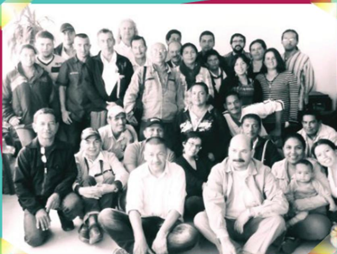
*Fotografía: Mónica Örjuela